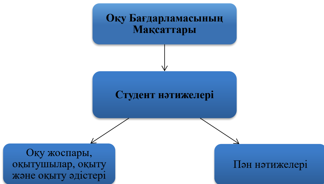
1 – Сурет: Оқу бағдарламасының анықтамасындағы әртүрлі компоненттердің өзара байланысы